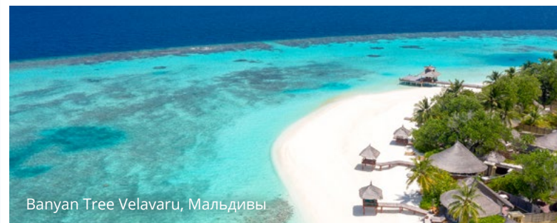
Banyan Tree Velavaru, Мальдивы