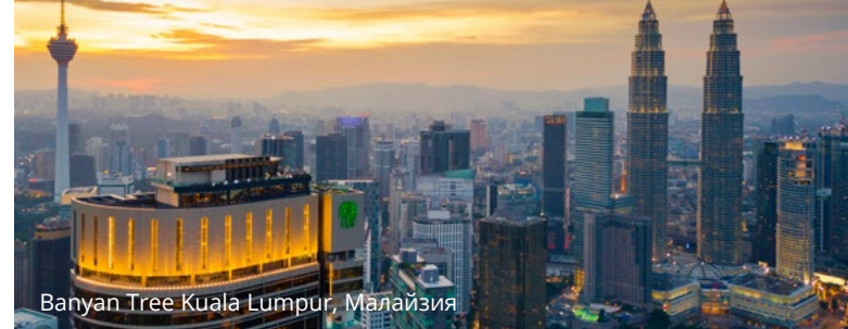
Banyan Tree Kuala Lumpur, Малайзия

Бесплатное участие в программе Banyan Living, новой глобальной сети по аренде частных резиденций Banyan Group, также помогает вам получать максимальный доход от вашего дома для отдыха, если вы решите сдавать его в аренду.