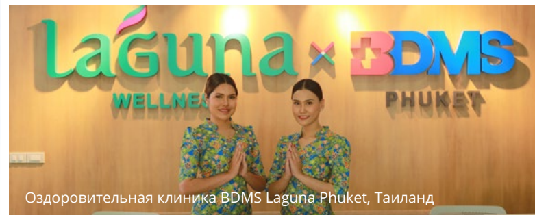
Оздоровительная клиника BDMS Laguna Phuket, Таиланд