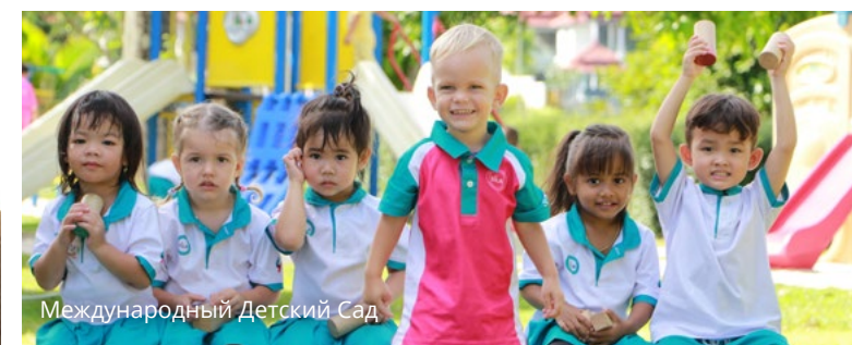
Международный Детский Сад